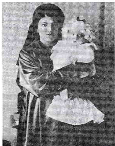
Le petit Dinu avec sa nourrice.

Dinu Lipatti a passé ses premières années d'enfance dans la nouvelle habitation de la rue Povernei n° 23, une allée ondulante qui formait avec d'autres rues – comme Visarion, Alecsandri, Pacienței – un vrai labyrinthe qui donnait dans le Boulevard Lascăr Catargiu.